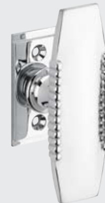
Bouton de fenêtre