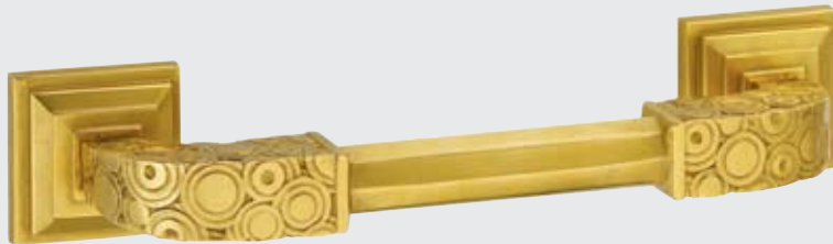
Poignée de tirage

Décorateur très fin, d'une distinction jamais démentie, auteur d'une quantité d'installations de magasins à Paris et d'intérieurs privés, il s'est pénétré intensément de la beauté classique et de la logique.