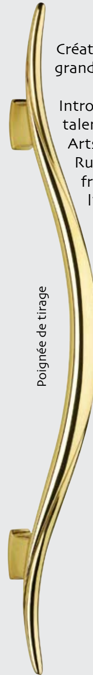
Poignée de tirage

Introduisant la modernité classique dans le mobilier, son talent est révélé lors de l'Exposition Internationale des Arts Décoratifs de 1925 où s'impose un véritable style Ruhlmann à la fois somptueux et mesuré. Décorateur français, il reflète l'élégance des formes, la discrétion de l'ornementation et la perfection technique.