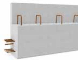
Poutre 20x30 cm