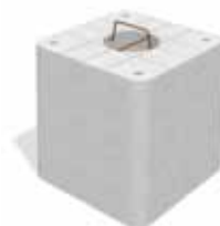
Plot en béton