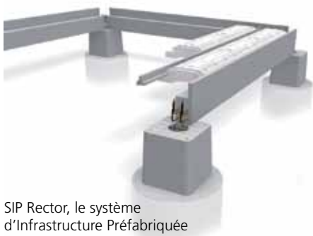
SIP Rector, le système d'Infrastructure Préfabriquée

Ce projet se singularise à la fois par la très haute performance énergétique de ses maisons, et par le niveau d'innovation dont l'ensemble des intervenants a dû faire preuve pour répondre aux exigences de qualité, de coût et de performance. Bouygues Immobilier a choisi des fournisseurs en mesure de s'impliquer dans la recherche de solutions innovantes propres à répondre à ce projet hors-norme.