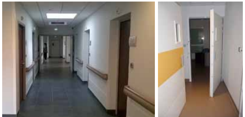
Coursives et chambre d'isolement de l'UPAO

Edifié sur un terrain qui accueillait autrefois le château de Sainte Gemmes-sur-Loire, le CESAME regroupe 35 bâtiments répartis sur 23 hectares. Depuis la mise en place, en 1970, de la sectorisation géographique, le département du Maine et Loire est découpé en 11 secteurs dont 9 sont rattachés au CESAME. En plus de l'hospitalisation complète, ce dernier propose des structures de prise en charge spécifique en fonction de l'âge et/ou de l'état de santé des patients. Autant de zones à sécuriser où se côtoient aujourd'hui les 400 patients hospitalisés, les 12.000 en consultation, les 1.300 employés, personnel médical compris, ainsi que les visiteurs, répartis sur l'ensemble des 7 secteurs de psychiatrie adulte et les 2 secteurs dédiés à la pédo-psychiatrie.