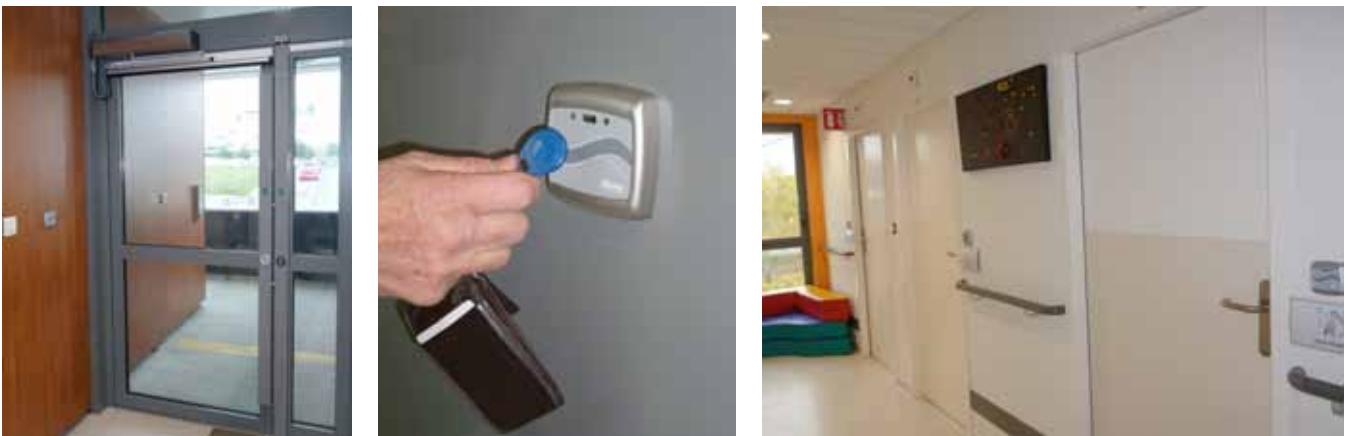
Serrure 20415 et lecteurs de badge C500 au centre Roger Misès

Pour assurer une condamnation sécurisée des différents accès et une bonne circulation des flux humains autorisés, l'Hôpital Psychiatrique disposait depuis 1955 d'un organigramme mécanique avec des clés Dény. En 1999, suite à des pertes de clés non signalées et pour sécuriser le système, le CESAME a souhaité moderniser le contrôle d'accès. Client historique de Dény Security, il s'est tout naturellement rapproché de l'industriel. A l'issue de l'appel d'offres, l'établissement a finalement retenu les solutions proposées par Dény Security car, tout en étant " plus intéressantes financièrement, plus souples et plus sûres ", elles répondaient en tout point aux exigences de ce type d'établissement : empêcher les intrusions et éviter les sorties des patients en hospitalisation sous contraintes.