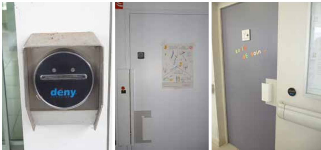
Lecteurs de badge C400 et serrure électrique motorisée à la MAS

Selon les lieux à sécuriser, Dény Security a fourni :