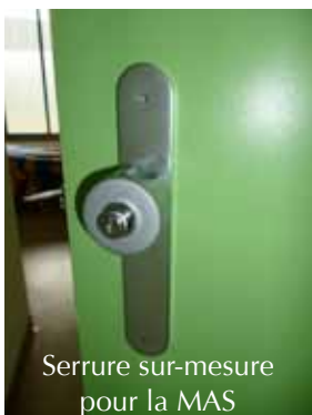
Serrure sur-mesure pour la MAS