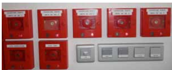
Boîtiers bris de glace

Quels que soient les accès (entrée principale, portes, ascenseurs...), tous sont équipés de lecteurs de badges centralisés C400 à piste magnétique et de lecteurs de badges de proximité C500 dans les bâtiments plus récents (l'UPAO et le centre Roger Misès), et ce afin de résoudre les problématiques d'effacement ou d'usure de la piste magnétique.