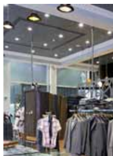
Ted Baker (Royaume-Uni)