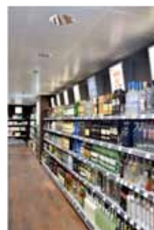
Aéroport Rotterdam (Pays-Bas)