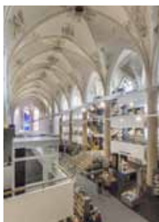
Librairie Waanders (Pays-Bas)