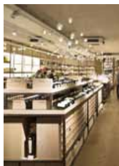
Hedonism Wines (Royaume-Uni)