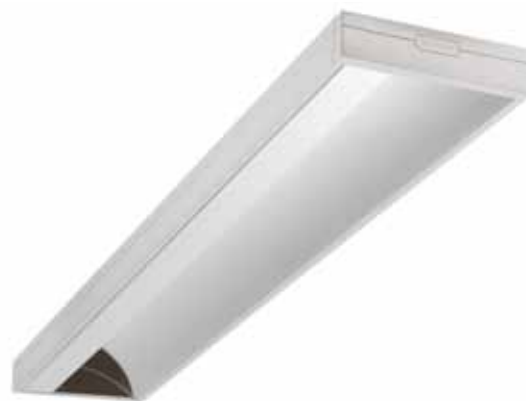
RANA LED Gen 2 asymétrique

Encastrés, en saillie ou suspendus, les luminaires RANA LED Gen 2 affichent un design épuré et discret pour s'intégrer aisément aux faux-plafonds ou créer des lignes continues harmonieuses.