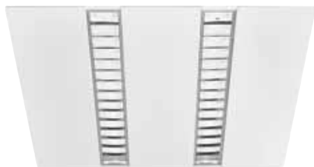
RANA LED Gen 2 600 x 600