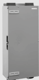
Zehnder ComfoAir 200 50 à 200 m³/h