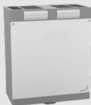
Zehnder ComfoAir 180 30 à 180 m³/h

Idéal pour les bâtiments neufs, des unités de ventilation avec des performances certifiées, du T2 au T5 et plus