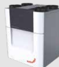
Zehnder ComfoAir Q 350; Q 450 et Q 600 40 à 600 m³/h