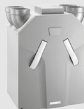
Zehnder ComfoAir 350 40 à 350 m³/h