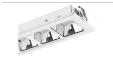
OPTIX R4 Cells