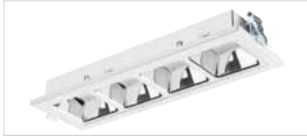
Version réflecteur aluminium (UGR < 18)

Au design discret et compact (310 x 100 x 45 mm), OPTIX R4 CELLS est parfaitement adapté pour compléter des projets réalisés avec les autres luminaires de la gamme modulaire OPTIX et garantir ainsi une uniformité esthétique. Disponible avec réflecteur aluminium ou blanc, en standard, il est conçu pour s'intégrer dans les plafonds des espaces restreints (couloirs, petits bureaux ...).