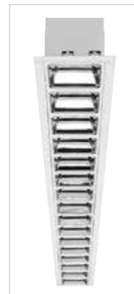
OPTIX Linear Encastré/Surface

Fabriquée en France par l'usine Sylvania de Saint-Etienne, la gamme OPTIX est 100% personnalisable pour répondre à tous les projets des architectes et concepteurs lumière :