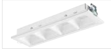
Version réflecteur blanc (UGR < 22)

Grâce à la parfaite combinaison des 4 cellules LED avec le diffuseur et les réflecteurs haute performance, OPTIX R4 CELLS offre un contrôle optimisé de l'éblouissement (UGR < 18 pour la finition aluminium et UGR < 22 en blanc).