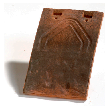
tuile PLATE Tradition 17x27