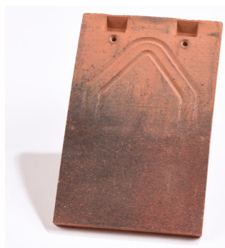
tuile PLATE 17x27

Toutes disposent d'un système anti-siphonage éprouvé qui assure à la toiture une étanchéité optimale.