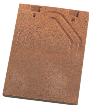
tuile PLATE 16x24