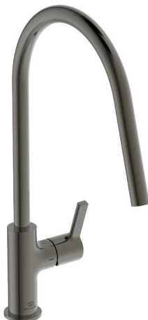
Gusto col de cygne tube rond gris magnétique - 365 € HT