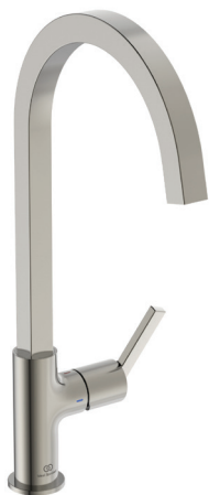
Gusto col de cygne tube carré gris orage - 365 € HT

Les mitigeurs de cuisine Gusto sont proposés en finition chrome classique ainsi que dans les quatre finitions PVD (gris orage, or brossé, gris magnétique et cuivre brossé), exclusives d'Idéal Standard. Le PVD est un revêtement dix fois plus résistant aux rayures et possède une dureté de surface trois fois plus élevée que les autres revêtements du marché. Des tests indépendants démontrent que les robinets à finition PVD d'Idéal Standard sont si durables qu'ils sont toujours exempts de rayures et de marques d'abrasion après 10 000 cycles d'utilisation.