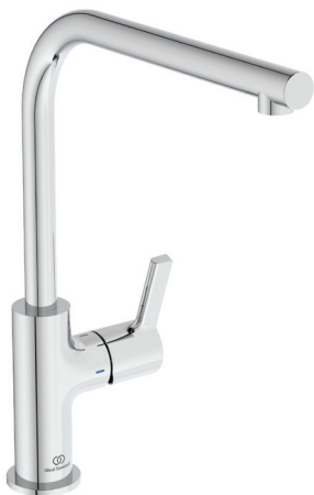
Gusto tube en L chrome - 239 € HT