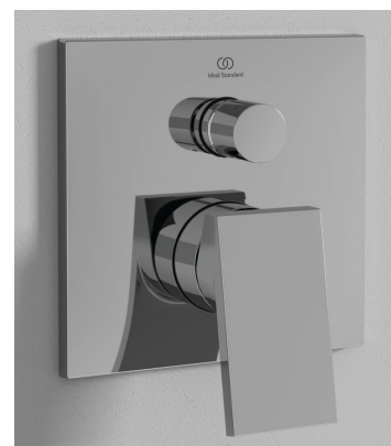
Mitigeur de douche avec inverseur à encastrer EXTRA chrome - 265 € HT