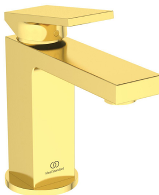
Mitigeur lavabo EXTRA sans tirette ni vidage - or brossé - 387,60 € HT