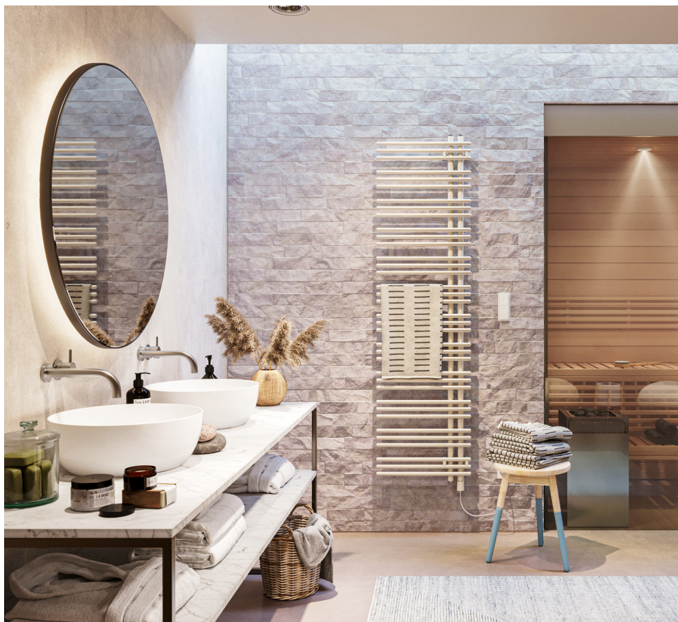
Acova Manava asymétrique électrique, L 478 x H 1810 (750 W) – couleur White Quartz – Prix public indicatif HT : 920 € (option couleur incluse)

Pour répondre à toutes les envies, Manava se décline en deux styles (en épi et asymétrique à droite ou à gauche) alliant praticité et élégance et dans deux versions (électrique ou chauffage central) pour s'adapter à toutes les installations. La position de ses tubes permet de suspendre serviettes ou peignoir en toute simplicité.