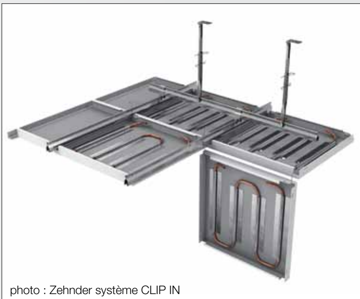
photo : Zehnder système CLIP IN